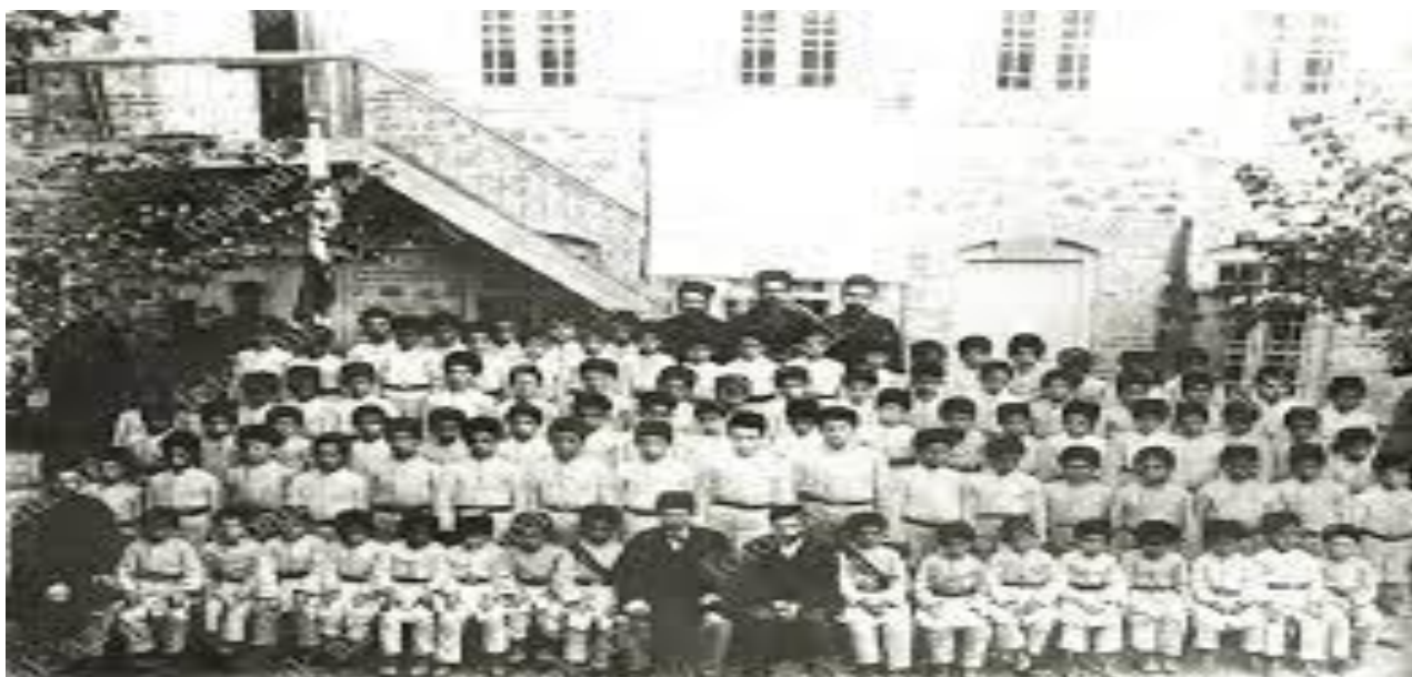
Şəki, üsuli-cədid məktəbi

Dinəndə yandı dilim, dinməyəndə dil yandı, Nə dərddi gizlədə bildim, nə aşikar elədim