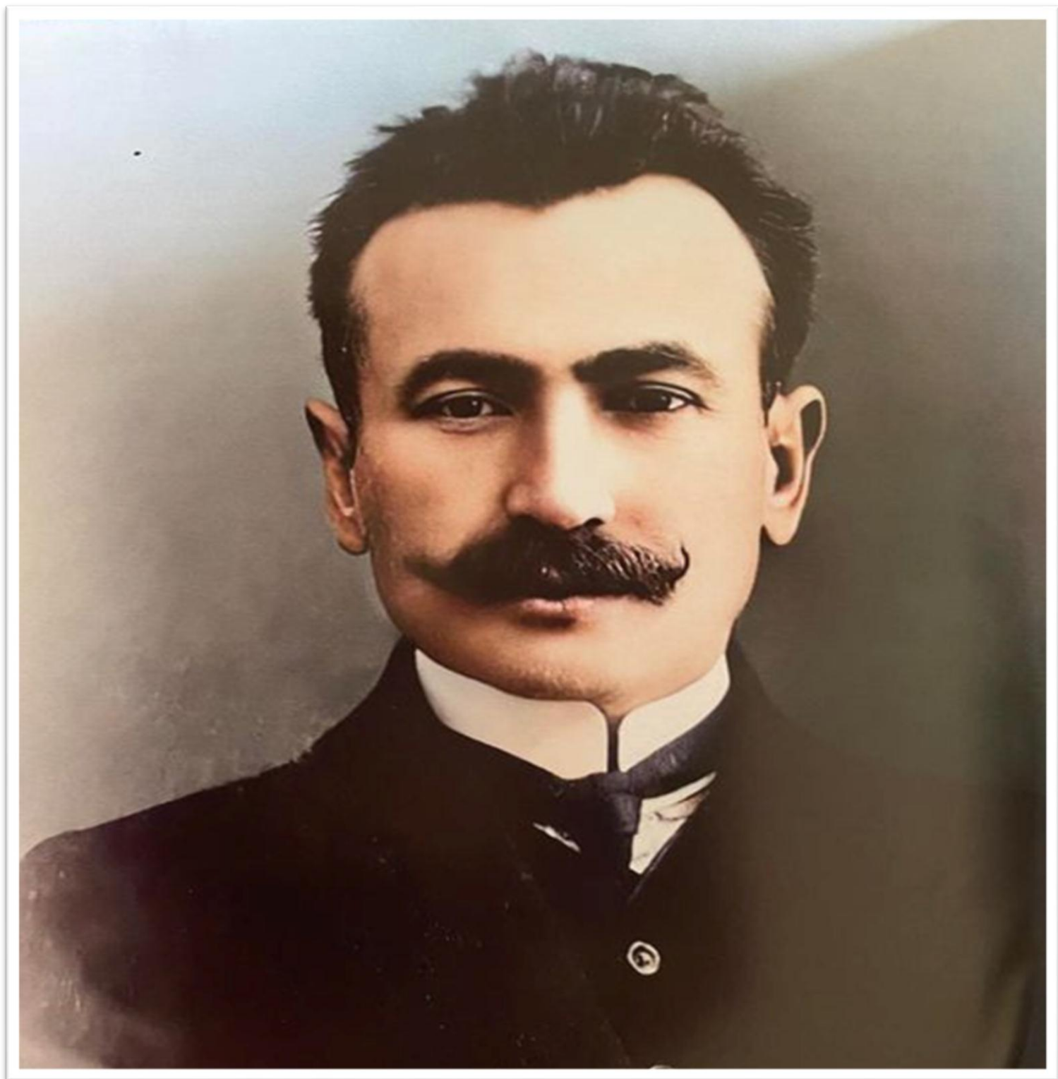
ÖMƏR FƏİQ NEMANZADƏ 1832-1937